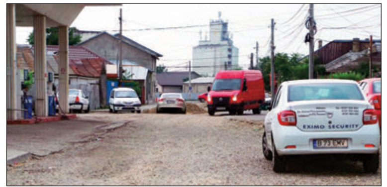
Termenul de execuție era 15 mai

discipline precum artă vocală și muzică instrumentală (la Liceul de Arte), medicină generală și psihologie generală (la Școala postliceală sanitară "Vasile Alecsandri"). De asemenea, catedre vacante au rămas la chimie (Liceul Dumitrești), industrie alimentară (la Liceul Tehnologic Odobești), dans contemporan (la Palatul Copiilor Focșani) și altele. Catedrele neocupate în ședința de miercuri vor fi transformate în catedre cu viabilitate de un an pentru care pot opta candidații cu note peste 7,00 în ședința din 28 august 2017. Prioritate atunci, la repartizare, vor avea profesorii titulari care au nevoie de completare de normă didactică. Reprezentantii IȘJ transmit că, potrivit metodologiei, directorii de școli au obligația ca, după fiecare etapă de mobilitate, să actualizeze lista posturilor și catedrelor vacante din unitățile pe care le conduc. Pe site-ul ZdV, într-un document atașat acestui articol, puteți vedea posturile și catedrele ocupate în ședința de miercuri. (M.V.)