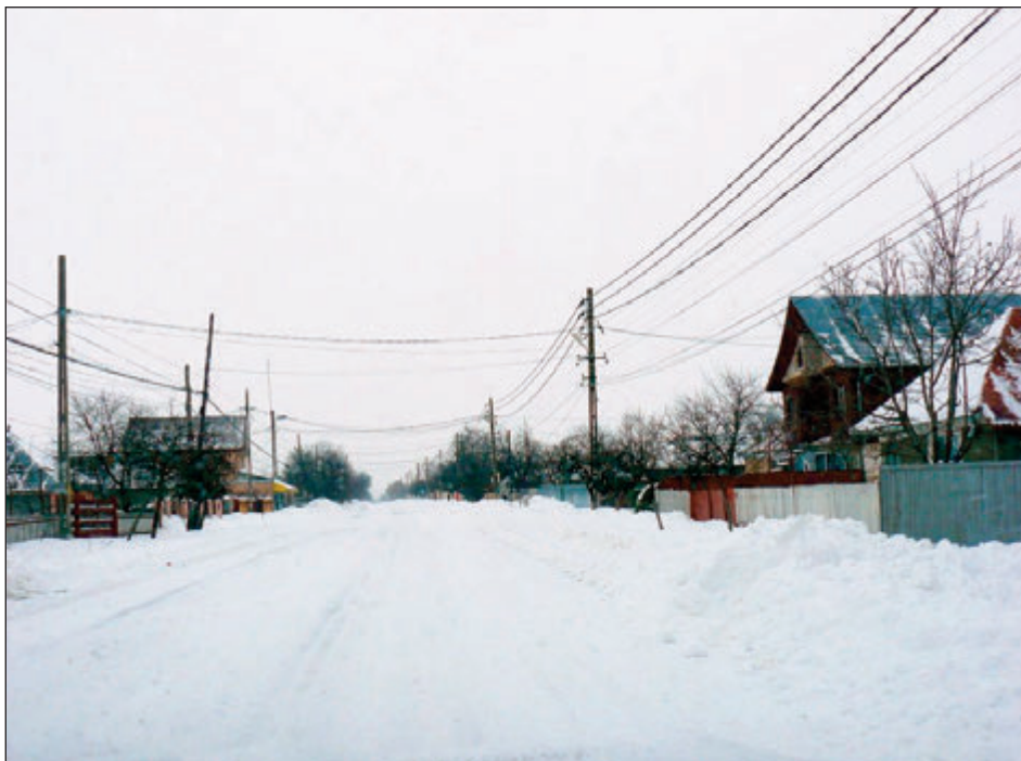
Sotirex deszăpezește drumurile județene din anul 2007

► contractul scos la licitație pentru următoarele trei ierni are o valoare de 5 milioane de euro, în condițiile în care în perioada 2014 - 2017 suma a fost de 2 milioane de euro ► din 2007, toate contractele au mers la o singură firmă, Sotirex Bacău ► pagina 2