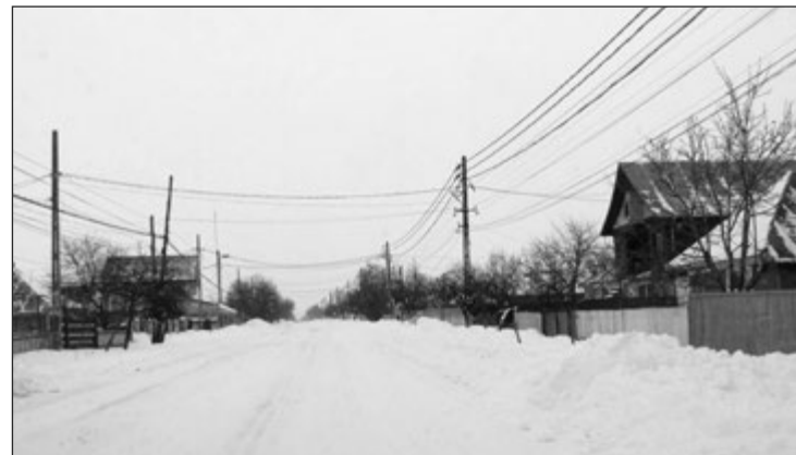
Sotirex dezapezește drumurile județene din anul 2007

De această dată, Consiliul Județean pregătește pentru următoarele trei ierni, 2017 - 2020, suma de 22,7 milioane lei, fără TVA. În perioada 2014 - 2017 valoarea contractului a fost de 9,4 milioane lei, adică peste 2 milioane de euro. De menționat că în ultimii ani, de regulă, drumarii s-au confruntat doar cu un episod, două de ninsoare pe perioada iernii, iar zonele cu probleme au rămas aceleași. Dotările minime impuse pentru a participa la licitație prevăd ca firmele să aibă cel puțin 50 de utilaje, împărțite în două loturi, Nord și Sud. Lungimea drumurilor pe care trebuie să se acționeze este de 597,51 km, cu câțiva kilometri în plus față de precedentul contract. Suma pentru dezapezirea unui