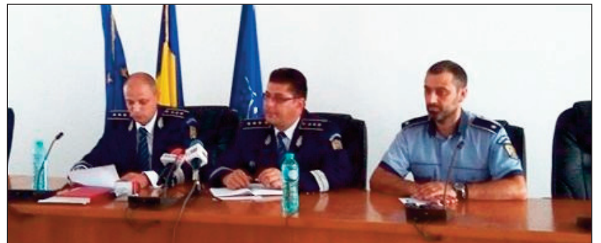
Conducerea poliției a prezentat bilanțul instituției pe primele șase luni ale lui 2017

Pe linia traficului rutier, în conformitate cu Programul Local „ALEGE