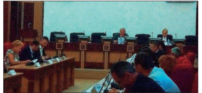
Consilierii PNL s-au abținut la proiectele de stabilire a noilor salarii