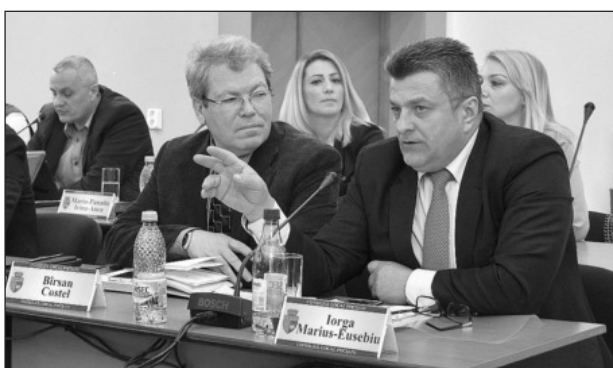
Încercarea moarte nu are