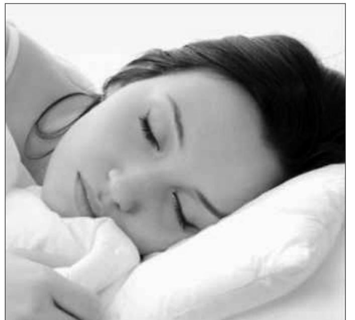
În timpul somnului, creierul se reîncarcă

- Persoanele nevăzătoare pot vedea imagini în visele lor, chiar dacă au fost orbi din naștere; - În numai 5 minute de la trezire 50% din persoane au uitat