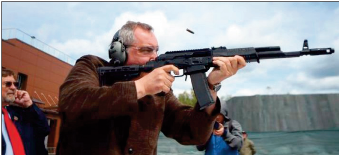
Un vicepremier belicos

"Sunt unii dintre cei mai buni instigatori ai tuturor campaniilor antirus, împreună cu balticii și britanicii. Deci la astfel de lucruri putem să ne așteptăm de la ei", a subliniat oficialul rus.